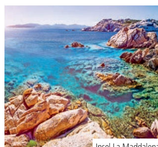
Insel La Maddalena

Entspannen Sie am nahegelegenen Strand oder unternehmen Sie eine fakultative Panoramafahrt ins Hinterland nach Nuoro, wo sardisches Brauchtum bis heute liebevoll gepflegt wird. Weiter geht es durch