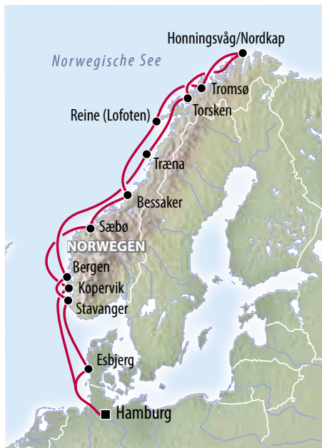
Für das individuelle Reiseerlebnis ist die Route im Januar speziell auf das Naturwunder Polarlicht ausgelegt und fährt dementsprechend mehr Häfen im Norden an, z. B. Alta – die Hauptstadt der Polarlichter.